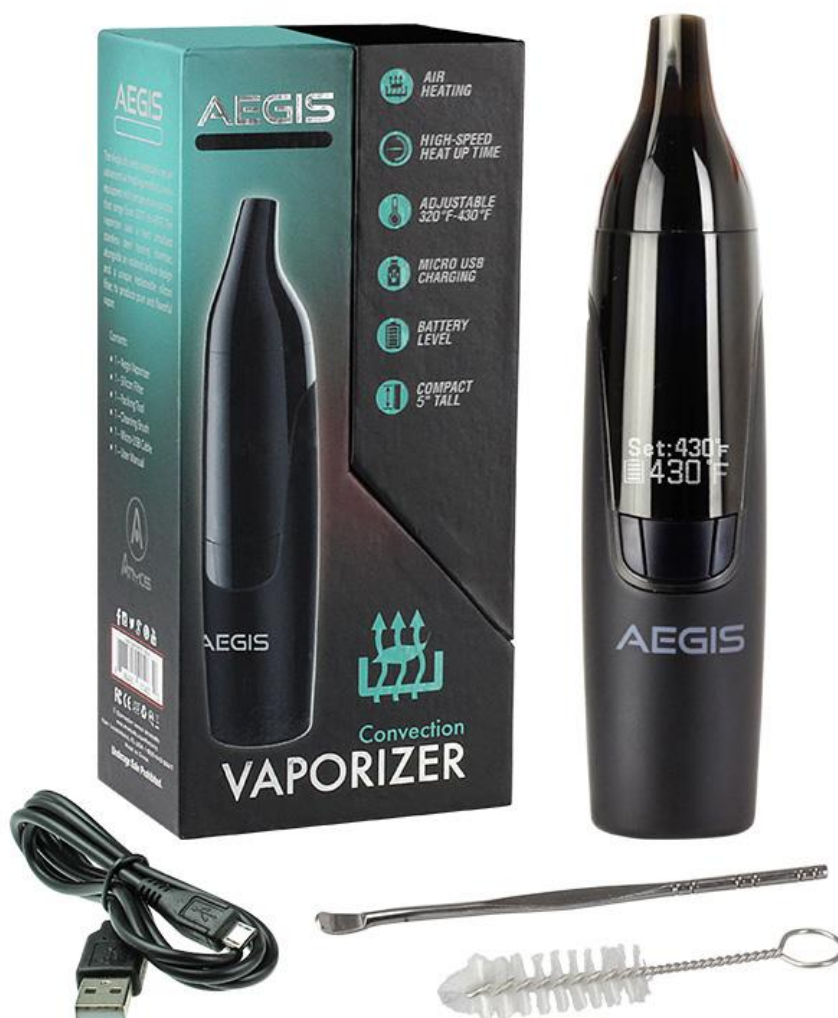
Atmos Aegis Vaporizer