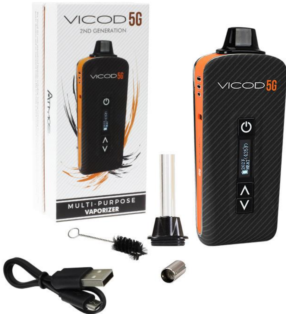
Atmos Vicod 5G 2nd Generation Vaporizer Black